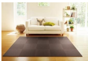
< 東リ絨 > 吸着分割カーペット 3.2㎡ 40cm×40cm 20枚セット

返礼品には、伊丹の「いいもの(地場産品)」あつめました。 兵庫県内のふるさと寄附共通返礼品である「但馬牛、神戸ビーフ」もご用意しています。 < 返礼品の一例 >