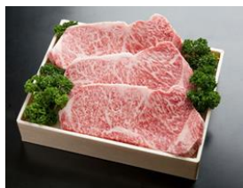
《兵庫県ふるさと納税地域資源認定》 神戸ビーフ ロースステーキ