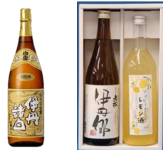
< 小西酒造(株) > < 老松酒造(株) > 各種日本酒

※伊丹市在住の方は、ふるさと寄附で税額控除を受けられますが、返礼品はございません